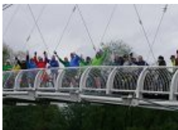
Foto ricordo 7° Biciclettata 2012 - Sondrio